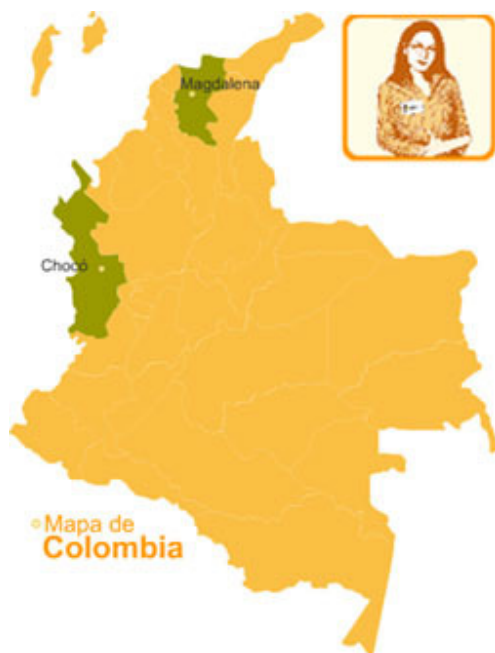
Mapa de Colombia