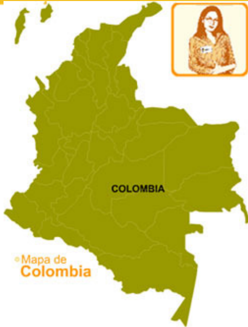
◦ Mapa de Colombia