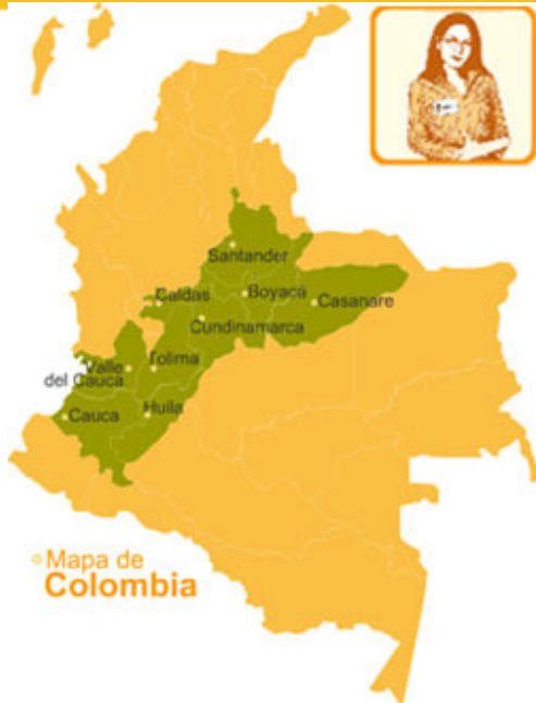
Mapa de Colombia

Mango: Atlántico, Bolívar, Córdoba, Magdalena, Sucre, Cesar, Antioquia, Cundinamarca, Santander, Norte Santander, Huila, Tolima, Caldas, Cauca.