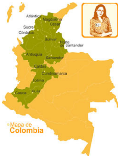
Mapa de Colombia

Mango: Atlántico, Bolívar, Córdoba, Magdalena, Sucre, Cesar, Antioquia, Cundinamarca, Santander, Norte Santander, Huila, Tolima, Caldas, Cauca.