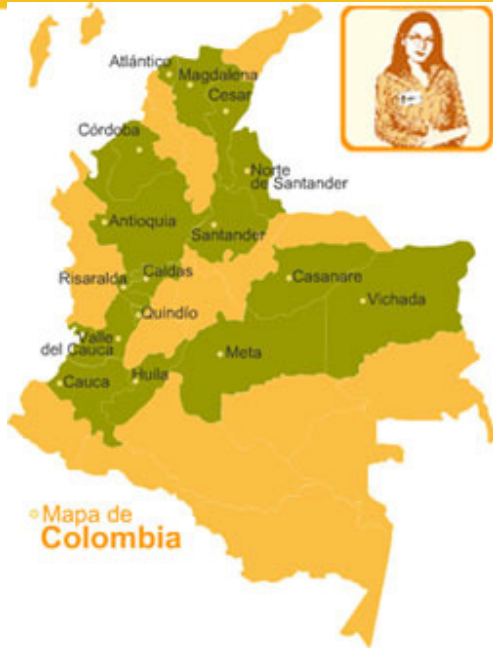
Mapa de Colombia