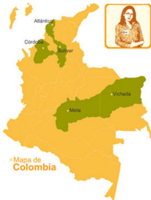
Mapa de Colombia

Marañón: Atlántico, Bolívar y Córdoba, Meta, Vichada